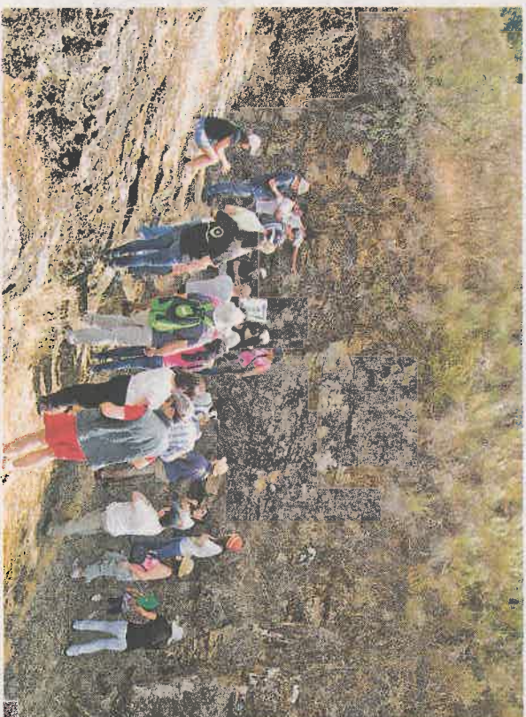
» GEOPARK vai constar dos roteiros mundiais

O autarca lembra que este é o primeiro território do Nordeste Transmontano a ser reconhecido pela UNESCO, “uma classificação que apenas mais